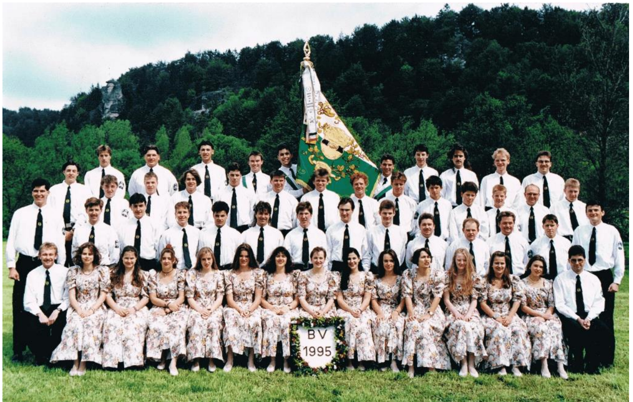
Gruppenbild 1995 mit den Festdamen

Das Fest war ein großer Erfolg für den Burschenverein Kinding, aber auch für die Ortschaft Kinding selbst. Das Fest wäre ohne die Mithilfe der gesamten Bevölkerung nicht zu bewältigen gewesen. Durch diese Veranstaltung wurde der Verein im weiten Umkreis, vor allem durch den Auftritt der „Spider Murphy Gang“, bekannt.