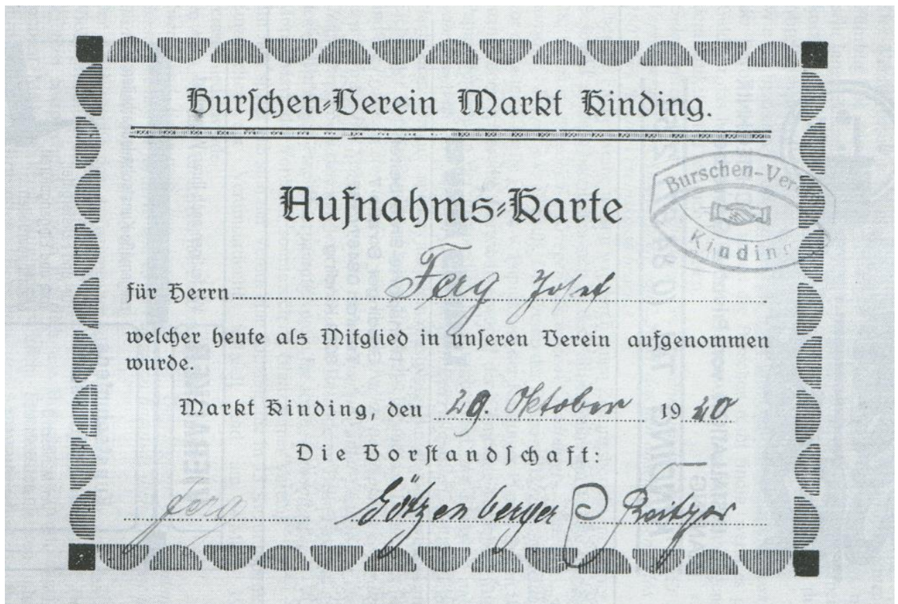
Dokument aus dem Gründungsjahr

Kinding war damals als Marktflöcken eine recht selbstbewusste Ortsgemeinde. Man war stolz auf die reiche geschichtliche Vergangenheit, auf die ehrwürdige Kirchenburg, auf die schöne Lage am Zusammenfluss von Altmühl, Anlauter und Schwarzach. Man strich die Naturschönheiten des Umlandes heraus und pries den weltberühmten Hopfen. Es gab auch schon einen bescheidenen Fremdenverkehr. So war es beinahe selbstverständlich, dass die Kindinger Jugend, wie in anderen Dörfern auch, einen Burschenverein haben wollten. Dieser Verein hatte als losen Zusammenschluss der männlichen Jugend seit 1919 einen sogenannten „Stopselclub“ zum Vorläufer.