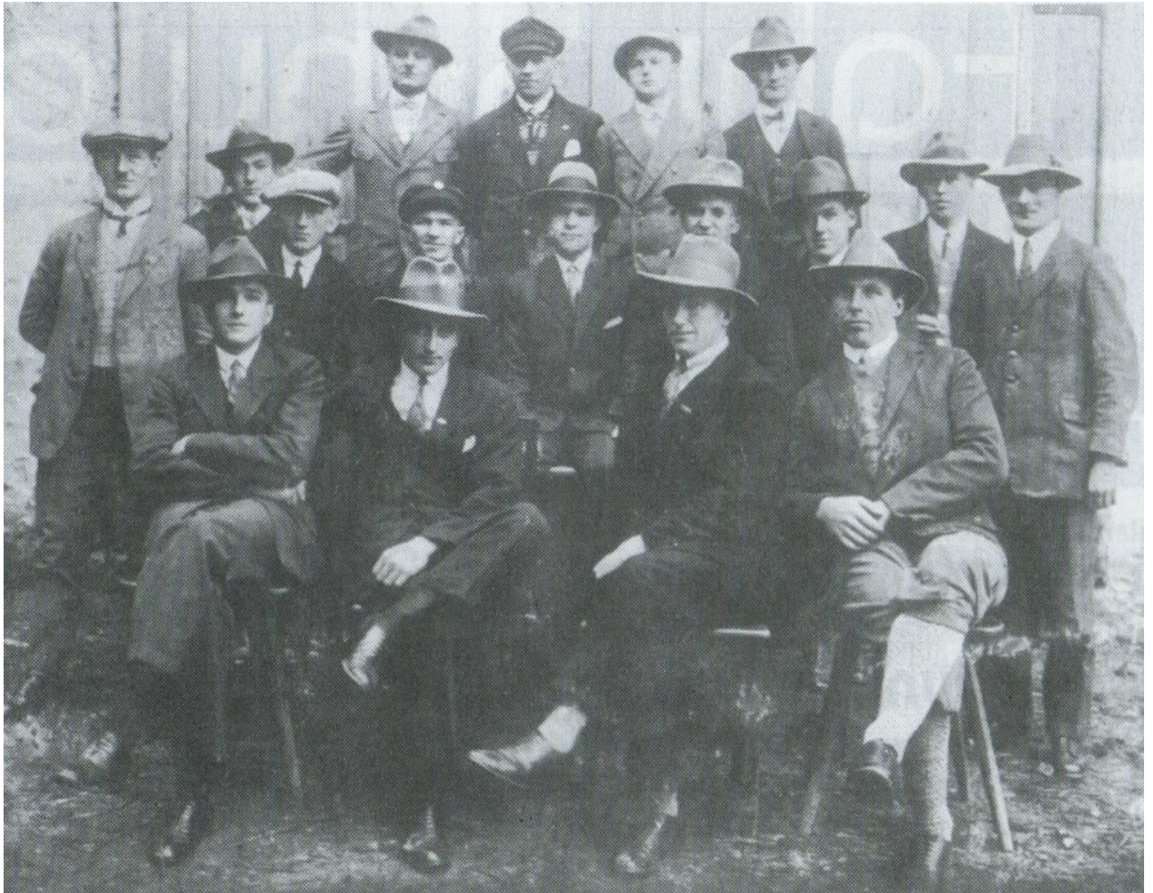
Vereinsfoto von 1925

Sehr beliebt war das Theaterspielen beim Sammiller. Das hat den Leuten gefallen, weil ja in Kinding nichts los war. Das war für die ganze Bevölkerung eine richtige Abwechslung.