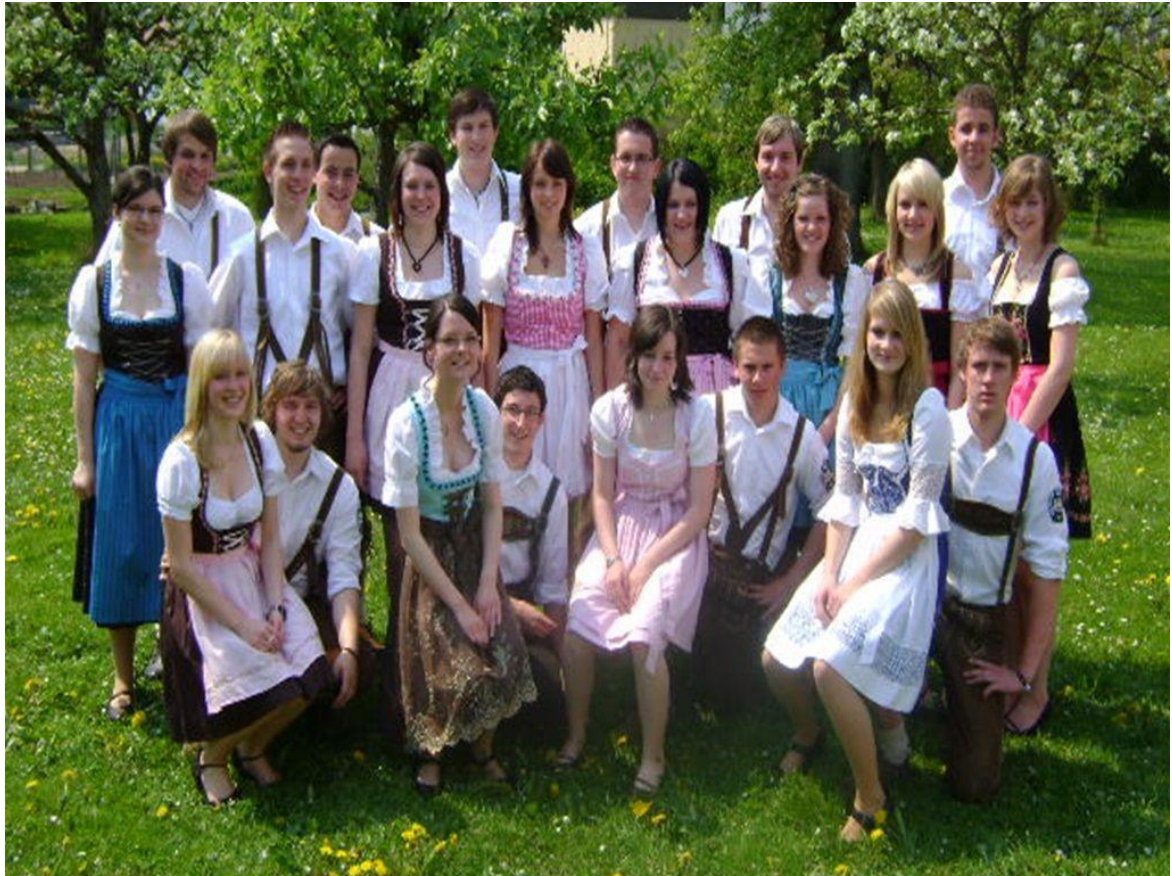
Gruppenbild der Maitanzgruppe 2009

Zum Abschluss der Vereinschronik ein Überblick über alle Termine und Veranstaltungen im Jahr 2009: