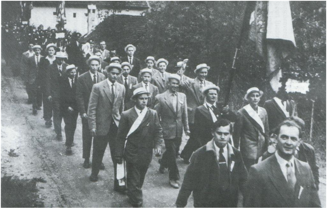
Der Burschenverein kurz nach der Wiedergründung bei einem Festumzug in Enkering