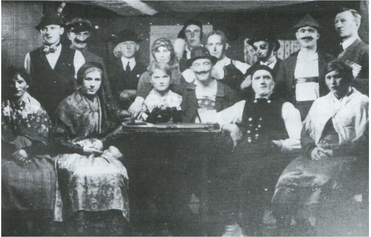
Theateraufführung in den zwanziger Jahren