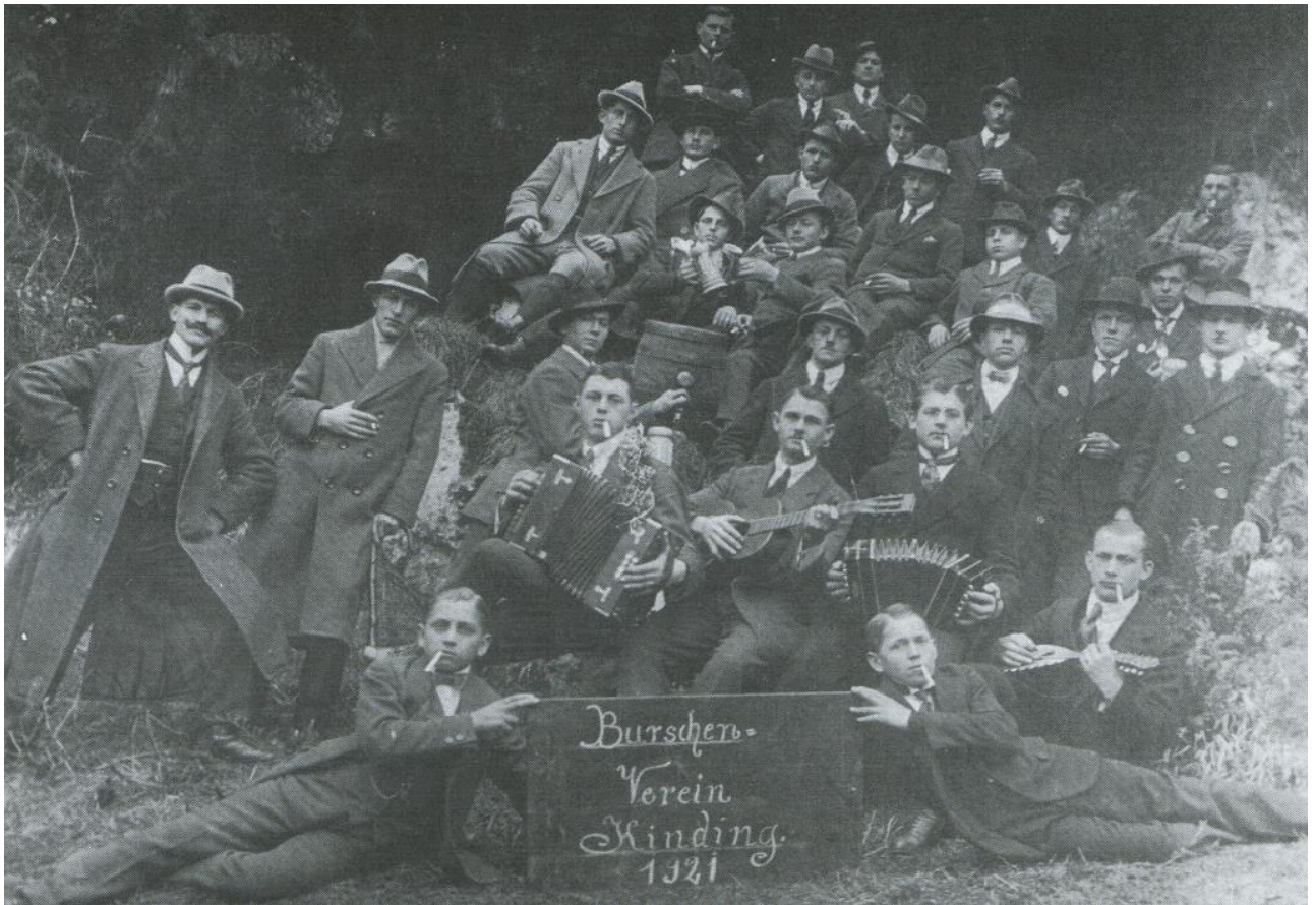
Der Burschenverein ein Jahr nach seiner Gründung 1921

In dieser Lage besannen sich einige Pfarrer auf die alten humanistischen und christlichen Werte. Um den jungen Männern auf dem Land eine geistige Heimat zu geben, strebten engagierte Dorfpfarrer die Gründung von katholischen Burschenvereinen an.