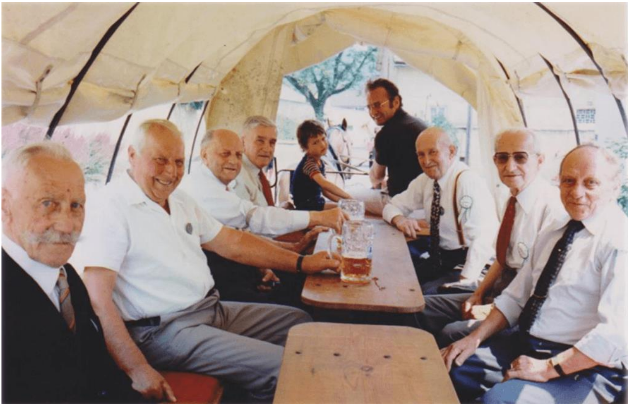
Gründungsmitglieder beim 60-jährigen Jubiläum 1980

Natürlich gingen die Veranstaltungen im Verlauf der Jahrzehnte nicht ohne Komplikationen über die Bühne. So kam es schon einmal vor, dass die zum traditionellen Burschenball verpflichtete Kapelle wegen eines Missverständnisses bei der Terminabsprache ganz wo anders spielte, nur nicht in Kinding, und die tanzwütigen Paare sich mit einer zweimannstarken „Notmusi“ begnügen mussten, die freilich auch erst nach 22 Uhr einsatzbereit war. Oder der Fähnrich steuerte, die Vereinsfahne im Kofferraum, nicht das zu irgendeinem Schützenjubiläum festlich geschmückte Dorf X. an, sondern brauste in ein ganz anderes, weit abgelegenes Nest, und kam erst in letzter Minute zur Erleichterung seiner Freunde am richtigen Ort an, nachdem man ihn über seinen Irrtum aufgeklärt hatte.