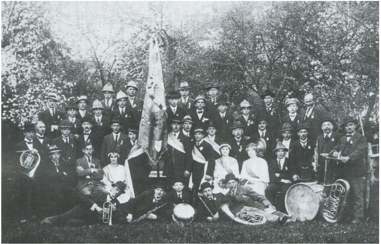
Gruppenbild bei der Fahnenweihe 1922

Der Art. 11 verdeutlicht, dass die Jugendlichen vor 75 Jahren scheinbar über mehr Zeit verfügten als heutzutage, denn jeden Samstag fand ein „Gesellschaftsabend“ statt. Dass der Verein auch erzieherische Ambitionen verfolgte, demonstriert Art. 15, wonach man aus dem Verein ausgeschlossen wurde, wenn ein Mitglied im Verein durch ungebührliches Benehmen und charakterloses Verhalten dadurch das Ansehen des Vereins öffentlich schändet.